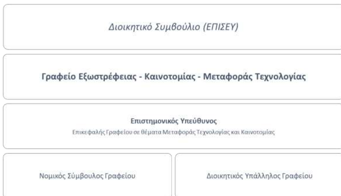
Εικόνα 2: Οργανόγραμμα Γραφείου Εξωστρέφειας Καινοτομίας και Μεταφοράς Τεχνολογίας ΕΠΙΣΕΥ

(ΕΥ) όσο και του Νομικού Συμβούλου επεκτείνεται στους άξονες μεταφοράς τεχνολογίας, διαχείρισης διανοητικής ιδιοκτησίας, ίδρυσης Τεχνοβλαστών και εμπορικής αξιοποίησης των ερευνητικών αποτελεσμάτων. Η στελέχωση του Γραφείου με ένα κατάλληλα καταρτισμένο προσωπικό στους συγκεκριμένους τομείς, θα επιτρέψει την κάλυψη όλου του φάσματος των αναγκών της. Επιπλέον, η λειτουργία του Γραφείου Μεταφοράς Τεχνολογίας δρα αυτόνομα, ωστόσο, βρίσκεται υπό την επίβλεψη του Διοικητικού Συμβουλίου του ΕΠΙΣΕΥ, όντας εναρμονισμένο τόσο με τον ν. 4957/2022 όσο και τον Οδηγό Χρηματοδότησης του Ιδρύματος. Περισσότερες πληροφορίες σχετικά με την διάρθρωση του Γραφείου, δίδονται στο Οργανόγραμμα που ακολουθεί.